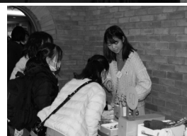
上：記念おはなし会 下：ミニバザー