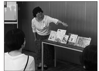
ブックトーク・ワークショップ

夏の恒例イベント、ブックトーク・ワークショップは4年ぶりに対面形式で実施、「おとなのためのお話会」は定員を段階的に増やしました。一方、コロナをきっかけにZoomの活用が