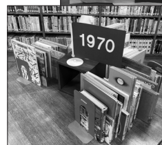
読書キャンペーンの様子